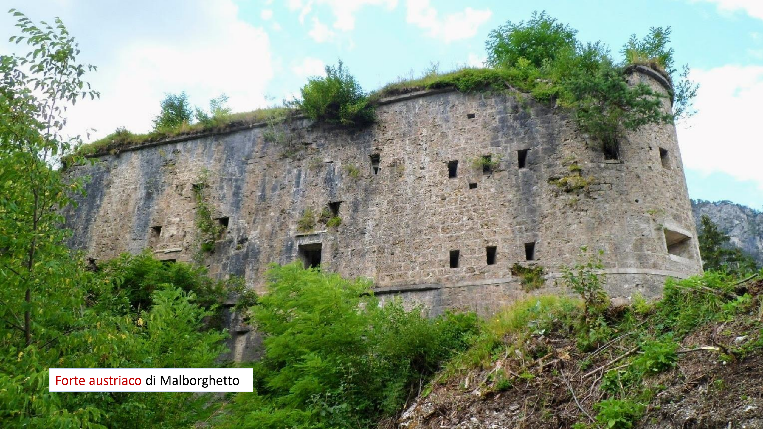
Forte austriaco di Malborghetto