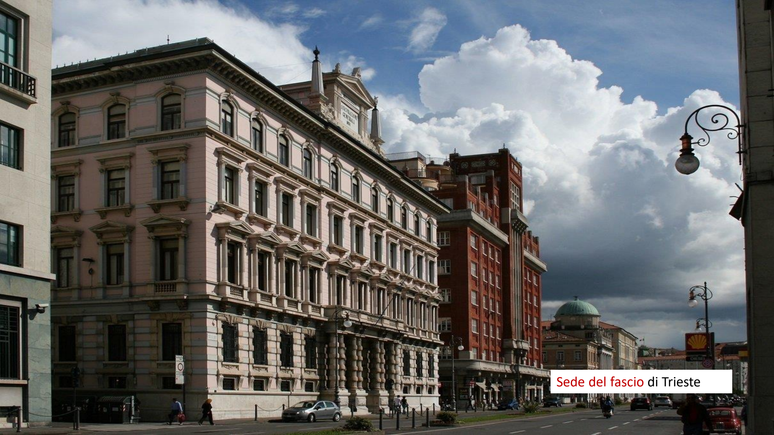
Sede del fascio di Trieste