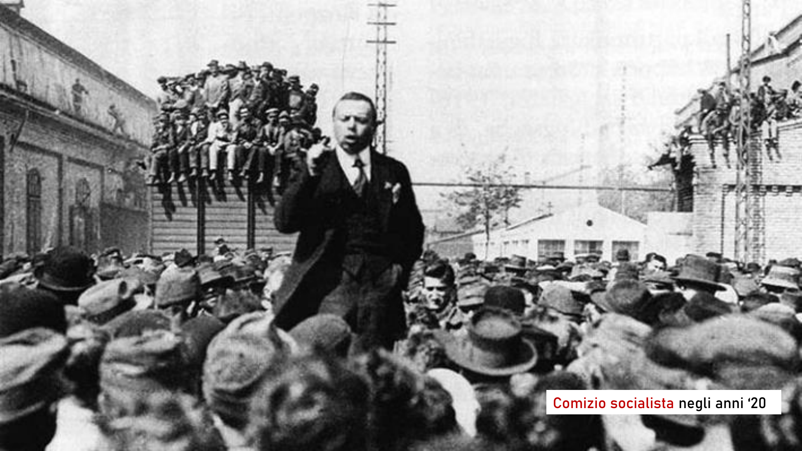
Comizio socialista negli anni '20