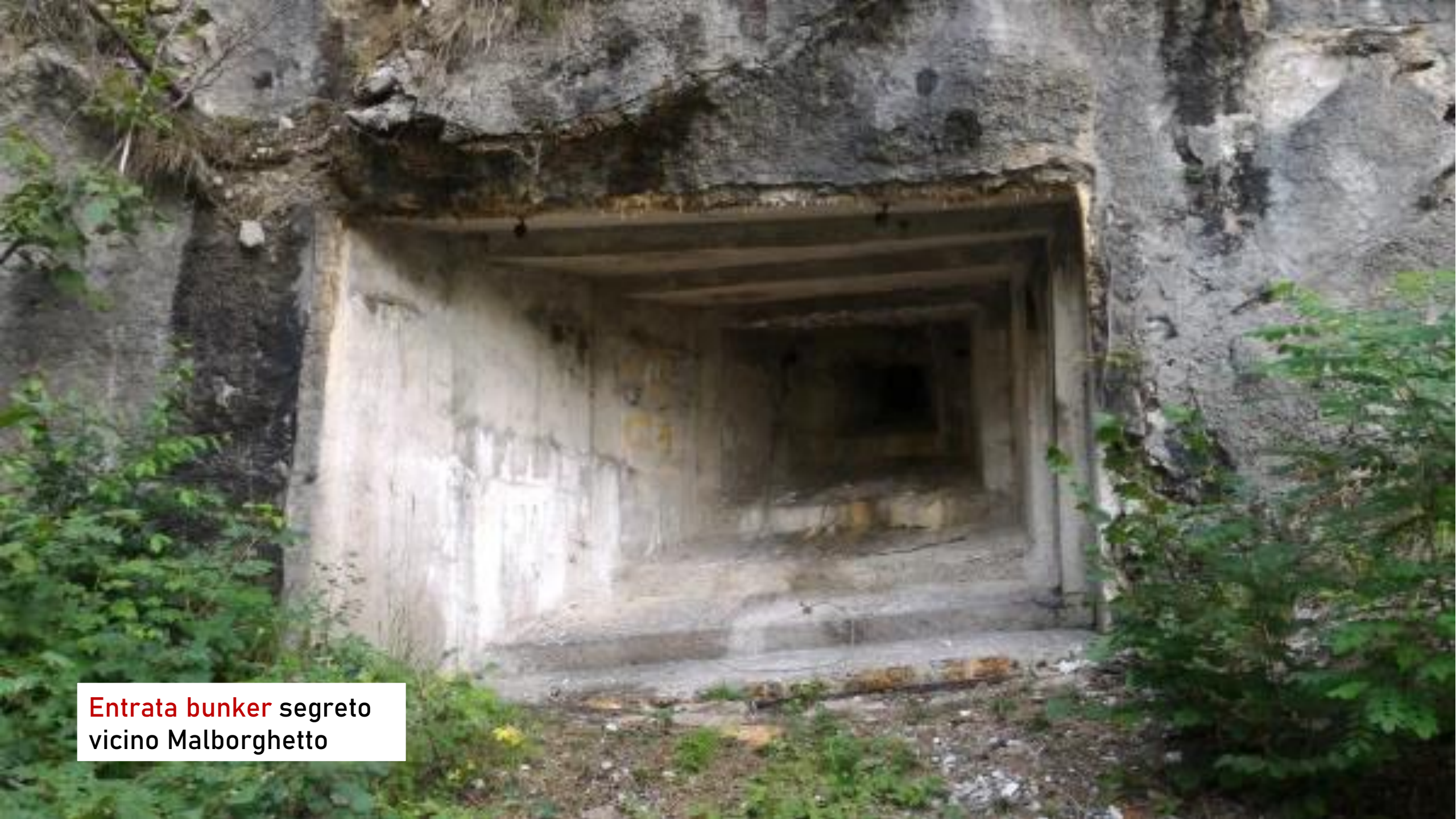
Entrata bunker segreto vicino Malborghetto